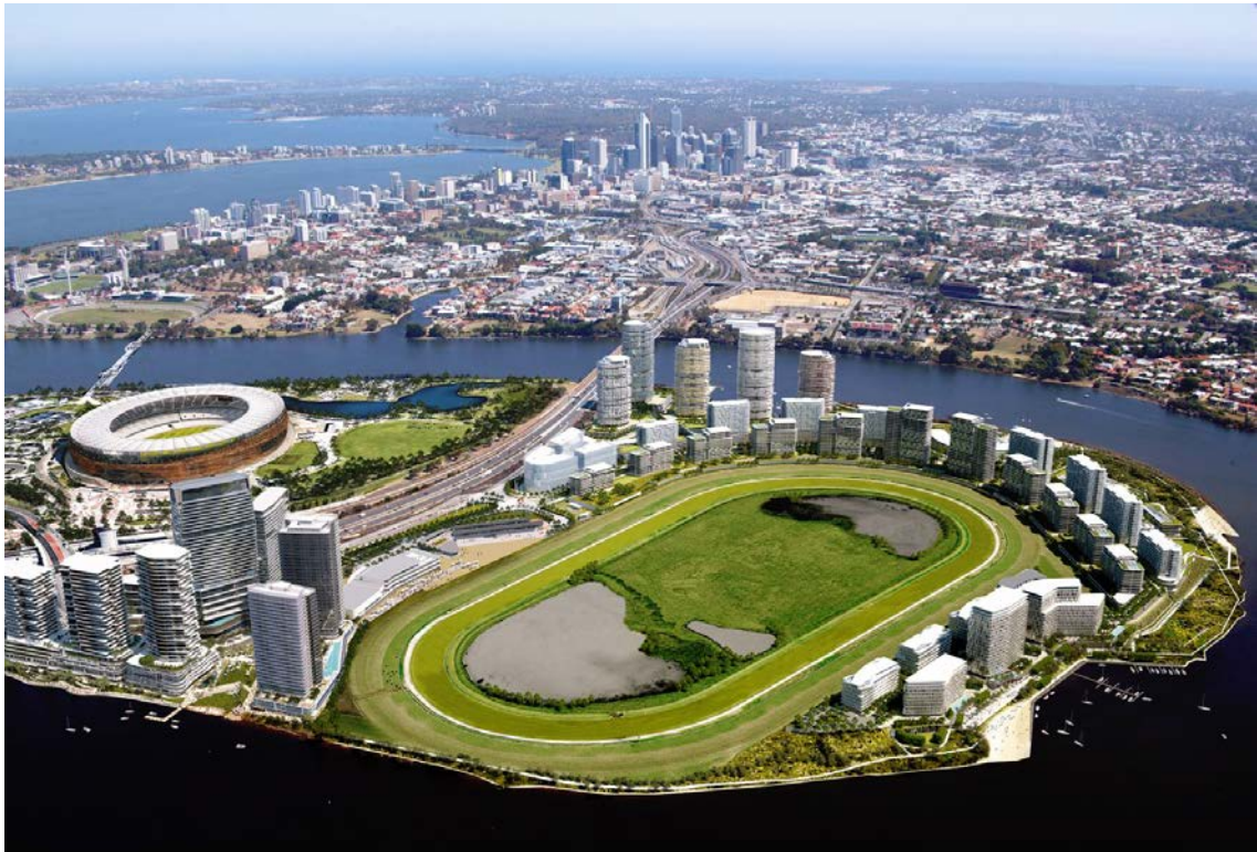
Figura 1 - Perspectiva Ilustrada da Proposta de Desenvolvimento.

Localizado na península de Burswood, em Perth, o hipódromo é objeto de um projeto de requalificação de todo o distrito, atualmente um centralidade para esportes e entretenimento. O projeto prevê um bairro multiuso, com 4,5 mil habitações, 60 mil m 2 de escritórios e 40 mil m 2 de lojas numa área de 38 hectares. O empreendimento prevê um investimento total de AU$3.8 bilhões.