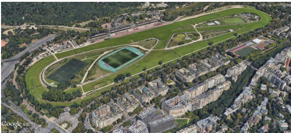
Figura 2 - Imagem Aérea Após a Intervenção.

O projeto de 2013 é fruto de uma parceria entre o hipódromo de Auteuil e a prefeitura de Paris, com o objeto de integrá-lo ao parque vizinho Bois de Boulogne. O paisagismo de Michel Pena associa os jardins a áreas de jogos e equipamentos esportivos (campo de futebol, campo de rugby, pista de atletismo, quadras de basquete e hockey, além das piscinas cobertas preexistentes) abrangendo uma área de 12 hectares.