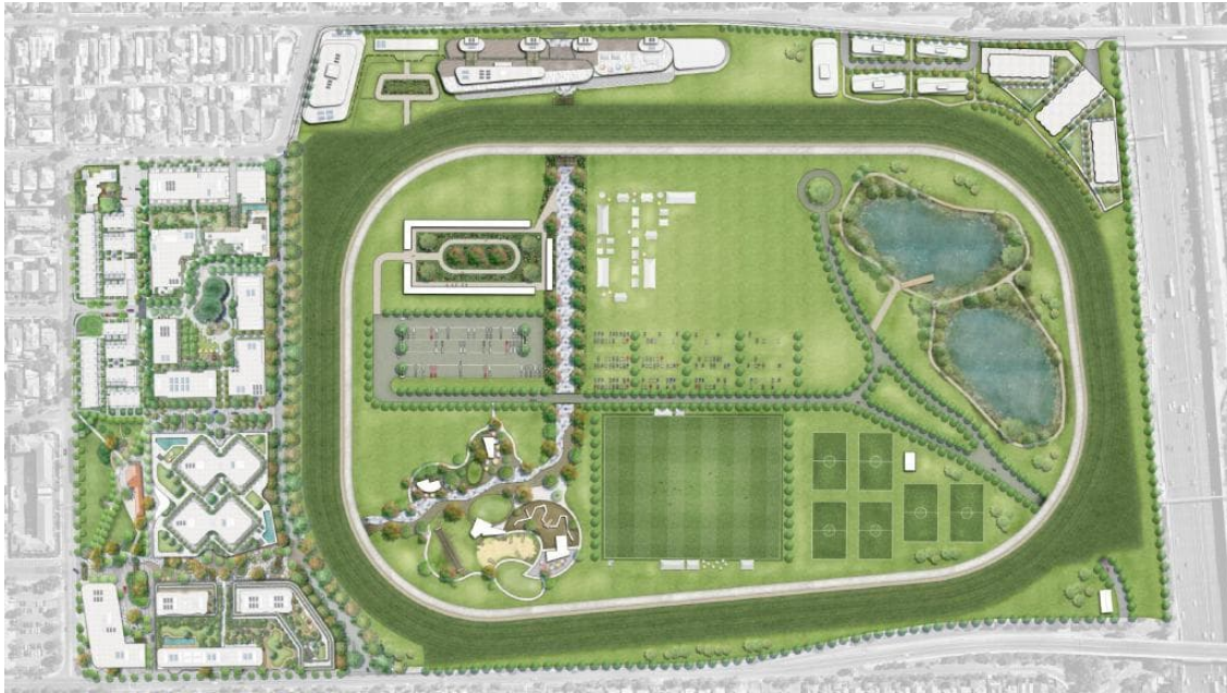
Figura 4 - Planta do Projeto de Desenvolvimento.

O projeto para o hipódromo de Moonee Valley em Melbourne, Austrália, prevê investimentos no valor de AU$2 bilhões em uma área de 40 hectares para produzir cerca de duas mil unidades habitacionais, além de lojas, escritórios e equipamentos comunitários para o bem-estar. O hipódromo também terá sua pista ampliada e construirá uma nova arquibancada para acompanhamento das corridas. A proposta tem prazo de implantação de dez anos, sendo que a construção do parque será a primeira das obras do complexo.